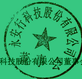
附表1：募集资金使用情况对照表

经核查，本保荐机构认为：永安行科技股份有限公司 2019 年度募集资金存放与使用符合《上市公司监管指引第 2 号——上市公司募集资金管理和使用的监管要求》、《上海证券交易所股票上市规则（2018 年修订）》、《上海证券交易所上市公司募集资金管理办法（2013 年修订）》等有关规定的要求，公司对募集资金进行了专户存储和专项使用，不存在变相改变募集资金用途和损害投资者利益的情况，不存在违规使用募集资金的情形。